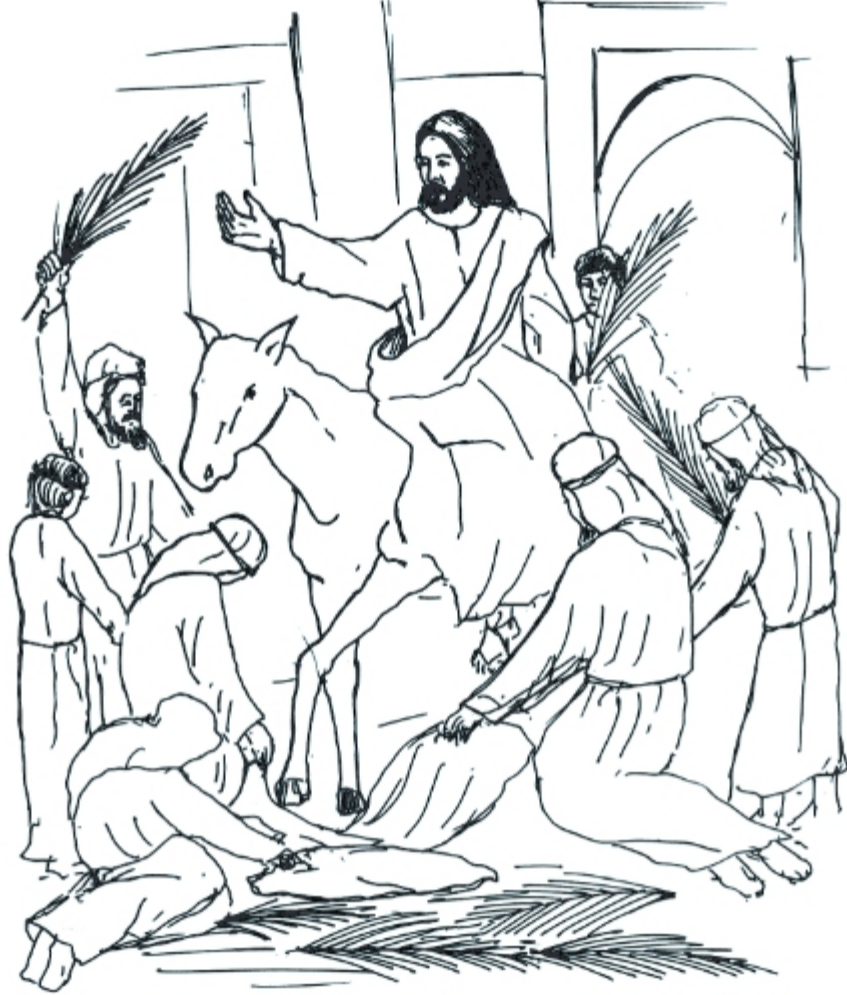
যীশুর যেরুসালেমে প্রবেশ

প্রভু যীশুকে উর্ধ্বে তুলে নেওয়ার দিনগুলো যখন খুব কাছে এসে গিয়েছিল তখন তিনি পুণ্যনগরী যেরুসালেমে যাবার জন্য দৃঢ় সিদ্ধান্ত নিলেন। তিনি জানতেন এই যেরুসালেমেই তাঁকে হত্যা করা হবে। তাঁর বাণীপ্রচারকালে তিনি তিনবার তাঁর শিষ্যদেরকে এই কথাটি স্মরণও করিয়ে দিয়েছিলেন। প্রভু যীশু যেরুসালেমে যাত্রার মধ্য দিয়ে এই ইজিত দিলেন যে, তিনি মৃত্যুবরণ করার জন্য যেরুসালেমে যাত্রা করছেন। কারণ যেরুসালেমেই সকল প্রবক্তাদের শহীদ মৃত্যুবরণ করতে হয়েছে। তাঁর বেলায়ও এর ব্যতিক্রম হবে না।