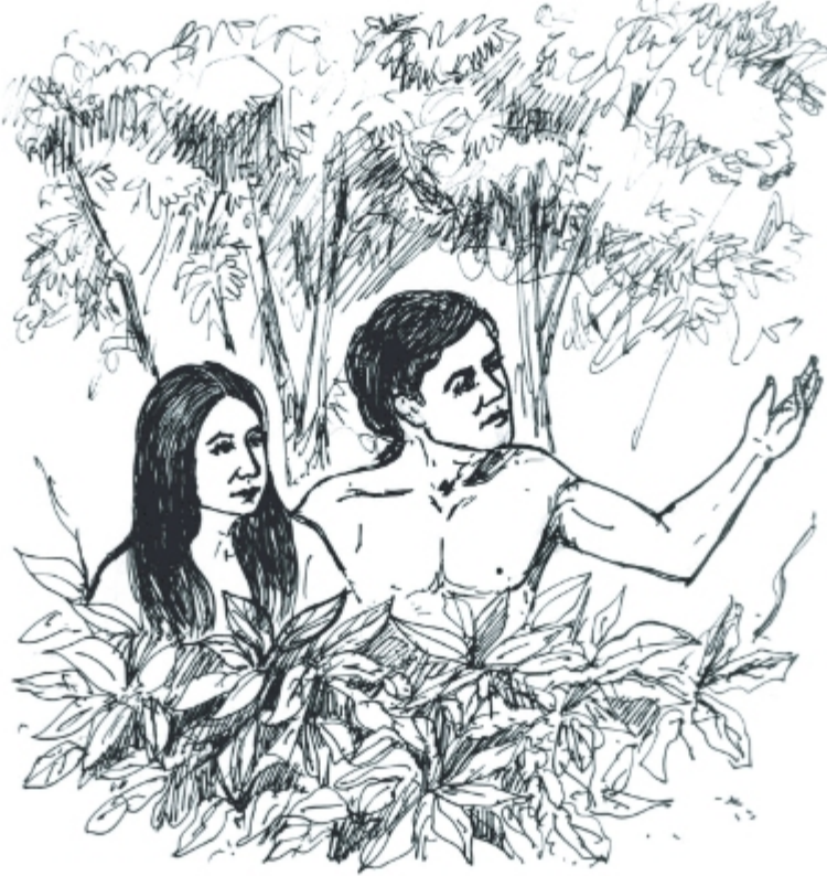
সর্বোত্তম সৃষ্টি মানুষ

সৃষ্টিকর্তা ঈশ্বর সবকিছু সৃষ্টি করেছেন। তাঁর সব সৃষ্টিই উত্তম। সকল সৃষ্টির মাঝেই রয়েছে ঈশ্বরের মহত্ত্বের প্রকাশ। ঈশ্বরের সৃষ্টির একটা প্রধান উদ্দেশ্য আছে, আর তা হলো ঈশ্বরেরই গৌরব। তিনি সুন্দর ও পবিত্র, তিনি বিশ্বময় বিরাজিত। সব সৃষ্টির শ্রেষ্ঠ হলো মানুষ। মানুষকে দেওয়া হয়েছে সমস্ত সৃষ্টির ওপর আধিপত্য করার অর্থাৎ যত্ন নেওয়ার দায়িত্ব। সমস্ত সৃষ্টির প্রতি যত্ন নেওয়া মানুষের একটি অন্যতম দায়িত্ব। একই সাথে সৃষ্টিকর্তার প্রশংসা ও গৌরব করা মানুষের কর্তব্য।