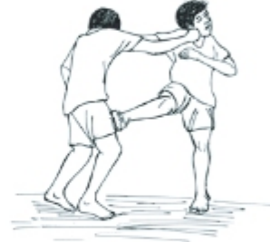
ক্রোধের কারণে ঝগড়া

৪। ক্রোধ: কোনো বিষয়ে রেগে যাওয়া। ক্রোধ বা রাগ হলো কোনো বিষয়ে নিজের মেজাজ নিয়ন্ত্রণে রাখতে না পারা। শুধু তাই নয়, রেগে গিয়ে ক্ষতিকর কিছু করে ফেলা। আমরা বলতে শূনি রেগে গেলে মানুষ বন্য পশুর মতো হিংস্র হয়ে যায়।