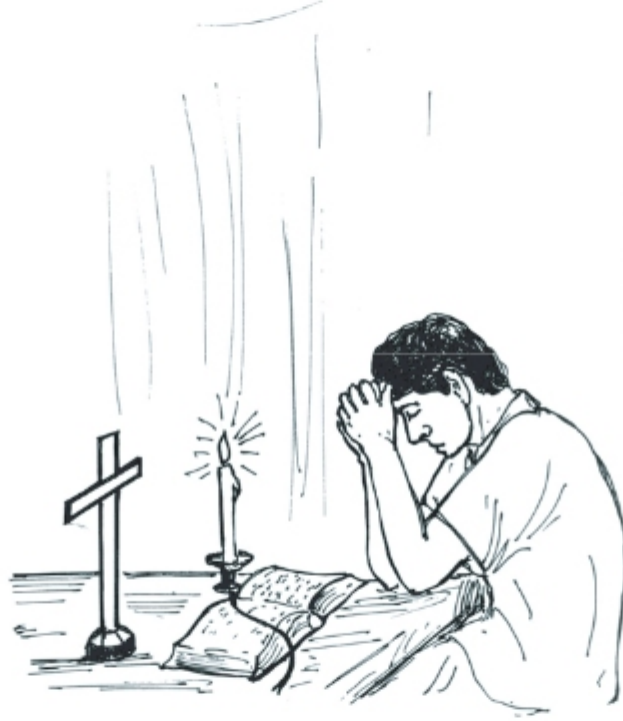
পাপের জন্য অনুতপ্ত ব্যক্তি

স্বজ্ঞানে মানুষ পাপ করতে পারে আবার অনেক পাপ করা থেকে সে বিরতও থাকতে পারে। তাই মানুষকে প্রথমেই পাপ করা বা না-করার একটা সিদ্ধান্ত নিতে হয়। যারা নিজেদের গৃহীত এই সিদ্ধান্তে অটল থাকে তারা পবিত্রতার পথে অনেক দূর অগ্রসর হতে পারে। যারা সিদ্ধান্ত নিয়ে তা পালন করে না, তাদের মধ্যে অবহেলার ভাবই বেশি। আর যারা পাপ করা থেকে বিরত থাকার কোনো সিদ্ধান্তই নেয় না, তাদের মধ্যে পাপের চেতনার অভাব। এখানে আমরা পাপ কী, পাপের প্রকারভেদ এবং পাপ থেকে মুক্তিলাভের উপায় নিয়ে আলোচনা করব। এর মধ্য দিয়ে আমাদের মধ্যে পাপবোধ সম্পর্কে নতুন চেতনা জেগে উঠবে।