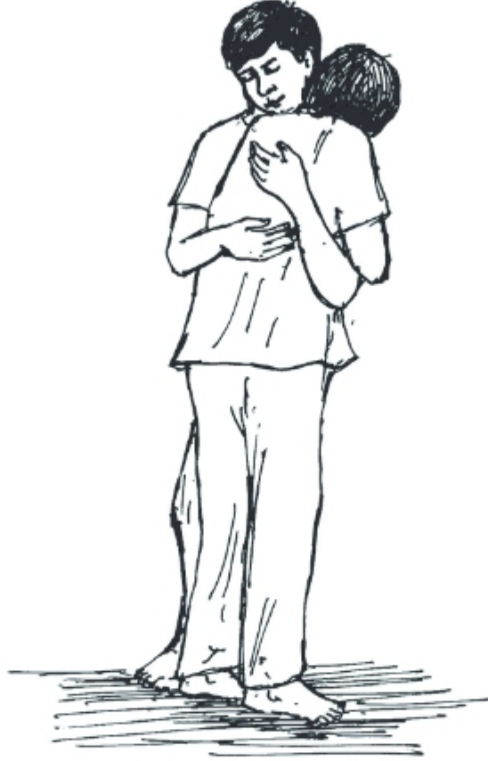
ক্ষমা ও পুনর্মিলন

ক্ষমা, সহনশীলতা ও দেশপ্রেম শুধু সামাজিক ও মানবিক মূল্যবোধ নয়, ধর্মীয় মূল্যবোধও বটে। ক্ষমার মনোভাব নিয়ে যে কোনো কাজ আমরা করব তা হবে উত্তম। সহনশীলতা আমাদের কাজে, চিন্তায় ও আচরণে পরিপক্বতা আনে। দেশপ্রেম মনের মাঝে ভালো কিছু করার ইচ্ছাকে আরও শক্তি জোগাবে।