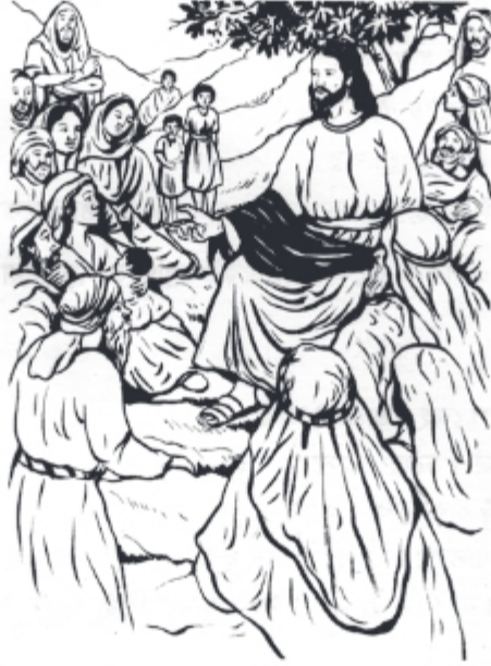
জনতার কাছে প্রচাররত যীশু

ঈশ্বর নিজেই ভালোবাসা। তিনি ভালোবেসে তাঁর একমাত্র পুত্র প্রভু যীশু খ্রীষ্টকে এই জগতে প্রেরণ করেছেন। যেন পুত্রের মধ্য দিয়ে মানুষ মুক্তি (পরিত্রাণ) পায়। প্রভু যীশু খ্রীষ্ট নিজেকে রিক্ত করলেন। দাসের স্বরূপ গ্রহণ করলেন। আকারে প্রকারে মানুষ হয়ে পবিত্র আত্মার প্রভাবে কুমারী মারীয়ার গর্ভে জন্মগ্রহণ করলেন। তিনি মানুষকে মুক্তির বাণী দিলেন। নিজে নিষ্কাপ হয়েও মানুষের পাপের জন্য ক্রুশে প্রাণ উৎসর্গ করলেন। পুনরুত্থান করে আমাদেরকেও তাঁর পুনরুত্থানের সহভাগী করলেন ও নতুন জীবন দান করলেন। তাঁর সম্পূর্ণ জীবনটাই ছিল একটি নিগূঢ় রহস্য। আমরা এই অধ্যায়ে তাঁর জীবনের রহস্যের বিভিন্ন দিকগুলো আলোচনা করব। এছাড়া তাঁর প্রকাশ্য জীবনের আরম্ভ থেকে যেরুসালেমে প্রবেশের বিভিন্ন দিকগুলো জানব।