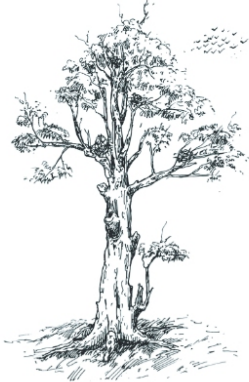
ঐশরাজ্য একটি বৃক্ষের মতো

খ) ঐশরাজ্যকে যীশু খামিরের সাথেও তুলনা করেছেন। খামির ততক্ষণ পর্যন্ত মাখাতে হয় যতক্ষণ- না তা গৈজে ওঠে।