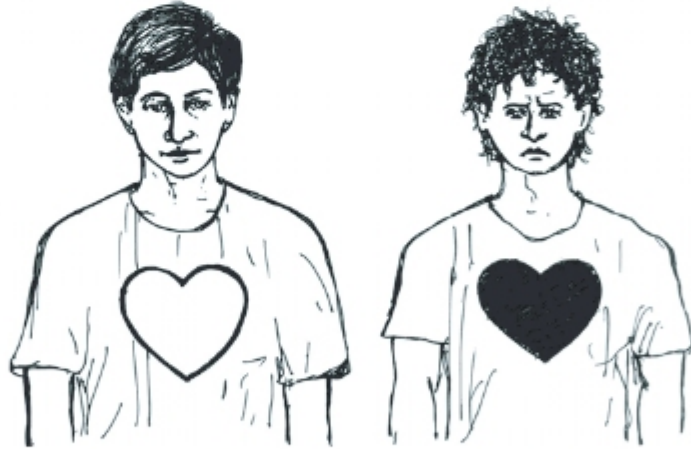
হৃদয়ের পবিত্রতার সাথে মানুষের মুখের পবিত্রতার সম্পর্ক

এর মধ্য দিয়ে প্রভু যীশু বুঝিয়েছিলেন মালিক হলেন স্বয়ং ঈশ্বর, গম হলো ভালো লোক, শ্যামাঘাস হলো মন্দ লোক, জমি হলো এই পৃথিবী, শত্রুপক্ষ হলো শয়তান। এই পৃথিবীতে ভালো ও মন্দ লোকের সহ-অবস্থান। ঈশ্বর পাপীর ধ্বংস চান না। বরং তিনি চান পাপী মন পরিবর্তন করে তাঁর পথে ফিরে আসুক। তাই তিনি অপেক্ষা করেন, সময়-সুযোগ দান করেন।