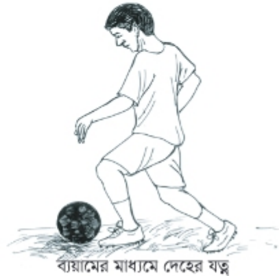
ব্যায়ামের মাধ্যমে দেহের যত্ন

দেহের যত্নের সাথে সাথে দেহের পবিত্রতার বিষয়টিও আমাদের লক্ষ করতে হবে। অনেক সময় মানুষ নানাভাবে দেহের অপব্যবহার করে থাকে। যেমন, নানারকম মাদকদ্রব্য সেবন করে, দেহের সঠিক যত্ন না নিয়ে বা নিজ দেহে নানারকম আঘাত করে দেহের ক্ষতিসাধন করে। কিন্তু ঈশ্বর চান আমরা আমাদের নিজেদের দেহকে সম্মান করি এবং অন্যদেরকেও সম্মান করি।