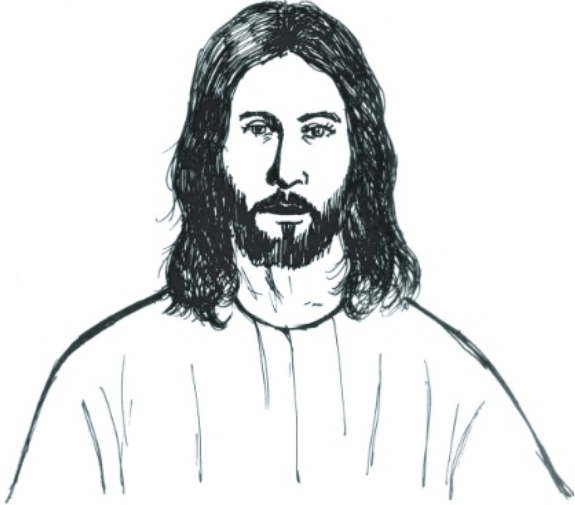
ঈশ্বরপুত্র যীশু খ্রীষ্ট

পিতা ঈশ্বর জগৎকে এতই ভালোবেসেছেন যে তাঁর একমাত্র পুত্রকে এ জগতে প্রেরণ করেছেন। পিতার ইচ্ছা হলো পুত্র ঈশ্বরের মধ্য দিয়ে মানবজাতিকে পতনের হাত থেকে রক্ষা করা। যীশুই হলেন পিতার অভিযুক্ত জন, মুক্তিদাতা খ্রীষ্ট এবং সকল জাতির সকল মানুষের প্রভু। তাঁর মধ্য দিয়ে মানবজাতি পরিত্রাণ লাভ করেছে এবং পেয়েছে শাস্ত জীবনের প্রতিশ্রুতি। তিনি প্রকৃত ঈশ্বর আবার প্রকৃত মানব। আমরা তাঁরই সম্পর্কে এই অধ্যায়ে জানতে চেষ্টা করব।