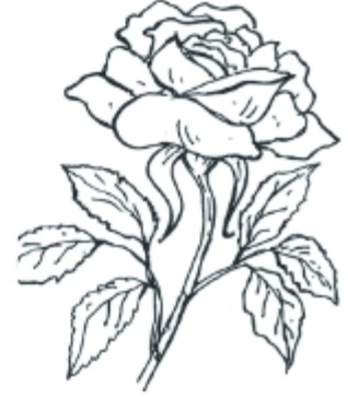
সৃষ্টির মাঝে ঈশ্বরের প্রকাশ

সৃষ্টিকে নিয়ে আমাদের এসব উপলব্ধির মধ্য দিয়ে সৃষ্টিকর্তারই গৌরব প্রকাশ পায়, তাঁরই গুণগান করা। সৃষ্টিকর্তাকে নিয়ে আমাদের ধ্যান ও সাধনা ব্যাপক। কারণ “সব কিছু তাঁর দ্বারাই অস্তিত্ব পেয়েছিল, আর যা-কিছু অস্তিত্ব পেল, তার কোনো কিছুই তাঁকে ব্যতীত হয়নি” (যোহন ১:১-৩)। সৃষ্টির মাধ্যমে তিনি নিজেকে জগতের কাছে প্রকাশ করেছেন।