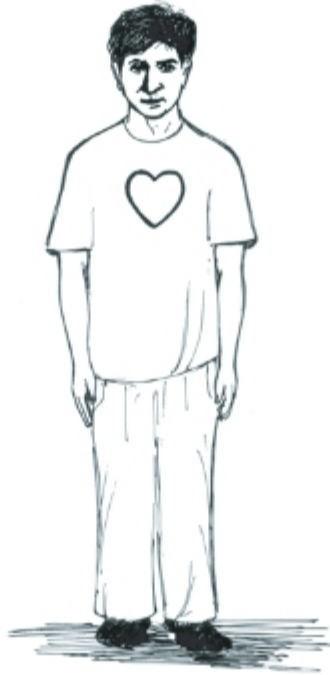
দেহ মন ও আত্মসম্পন্ন মানুষ

ঈশ্বর প্রত্যেক মানুষকে দিয়েছেন দেহ, মন ও আত্মা। দেহটা হলো বাইরে এবং এর চাইতে গভীরে আছে আমাদের মন। মনটা দেখা যায় না কিন্তু মনে কী হচ্ছে বা না হচ্ছে তা বাইরে থেকে অনেকটা বোঝা যায়। সবচেয়ে গভীরে হলো আমাদের আত্মা। সেখানে পৌঁছতে আমাদের অনেক সময় লাগে। তথাপি সেখানে যা থাকে তা-ই সবচেয়ে বেশি মূল্যবান। আমাদের দেহ মরণশীল। দেহ নষ্ট হয়ে গেলে মনও নিঃশেষ হয়ে যায়। কিন্তু আত্মা চিরদিন টিকে থাকবে। আমাদের এই অমর আত্মার সাথে ঈশ্বরের সাদৃশ্য রয়েছে। আমাদের দেহ, মন ও আত্মা মিলে হয় মানবসত্তা। এই শ্রেষ্ঠ মানবসত্তা আবার নারী ও পুরুষরূপে সৃষ্ট। এই নারী ও পুরুষ সমমর্যাদার অধিকারী। এবার আমরা দেহ, মন ও আত্মসম্পন্ন এই মানবসত্তার আরও গভীর অর্থ সম্পর্কে অবহিত হব।