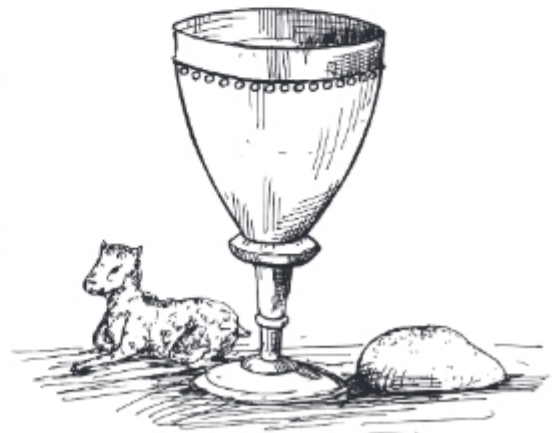
পূর্ণ ঈশ্বর ও পূর্ণ মানব যীশু খ্রীষ্ট আত্মোৎসর্গ করেছেন

এই অধ্যায়ের দীর্ঘ আলোচনায় আমরা বুঝতে পেরেছি যে, যীশু ঈশ্বর, আবার তিনি মানুষ। যীশু ঈশ্বর থেকে মানুষ হয়েছেন। তিনি প্রকৃত ঈশ্বর ও প্রকৃত মানুষ। একজন মানুষের থাকে দেহ, মন ও আত্মা। দেহ-মন-আত্মার প্রকৃতি নিয়ে মানুষ জন্ম নেয় এবং পূর্ণাঙ্গ মানবীয় স্বভাবে বেড়ে ওঠে। মানুষকে ঈশ্বর সৃষ্টির অন্য সবকিছু থেকে আলাদা করে সৃষ্টি করেছেন। মানুষকে দিয়েছেন বুদ্ধি ও ইচ্ছাশক্তি, যা অন্য কোনো সৃষ্টি বস্তু বা প্রাণীর নেই। তাই মানুষ অন্যসব জীবজন্তু থেকে আলাদা।